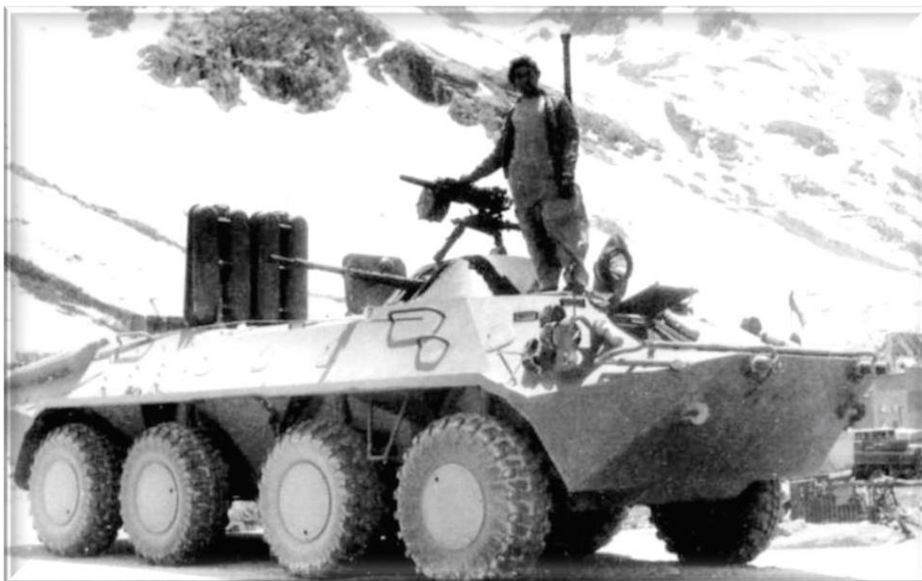
Боевым «крещением» для БТР-70 стал Афганистан