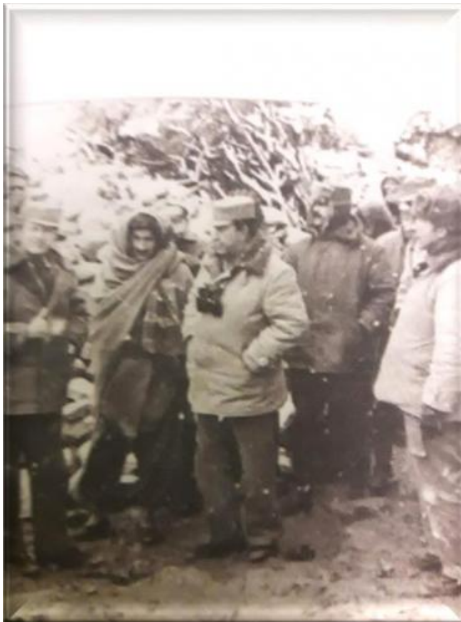
В центре генерал-лейтенант Шкруднев Д. Г., рядом в шапке полковник Тауфик Ахмат (мармольская операция 1983 г.)

между ног, там, где достоинство мужчин, две боевые гранаты, чеки которых половину были вытянуты.