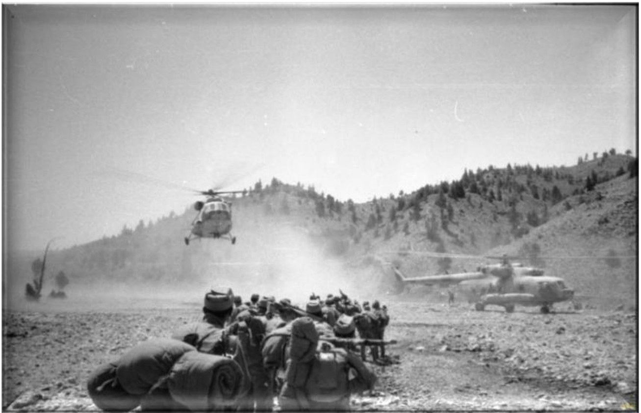
Рота связи ГВС

Порой приходилось срочно сниматься с одного места и перебазироваться в другой район, не заходя на базу в Кабуле. Бывало по завершении очередной операции, чтобы не возвращаться «домой» – дабы избежать ненужных потерь – мы «присасывались» к ближайшему советскому гарнизону, расположившись около него лагерем (почему-то на свою территорию «советские» нас не пускали. До сих пор не понимаю – почему). Чистились, стирались, мылись, занимались мелким ремонтом. Продовольствие, боеприпасы, запчасти, медикаменты нам доставляли по воздуху, вертолетами. И уже на следующую операцию мы выходили оттуда. Вот и получалось, что по два- три, а то и четыре месяца мы не заходили в ППД (пункт постоянной дислокации).