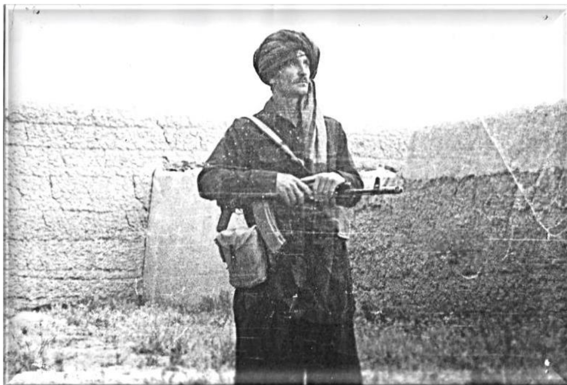
Маскировка под моджахеда