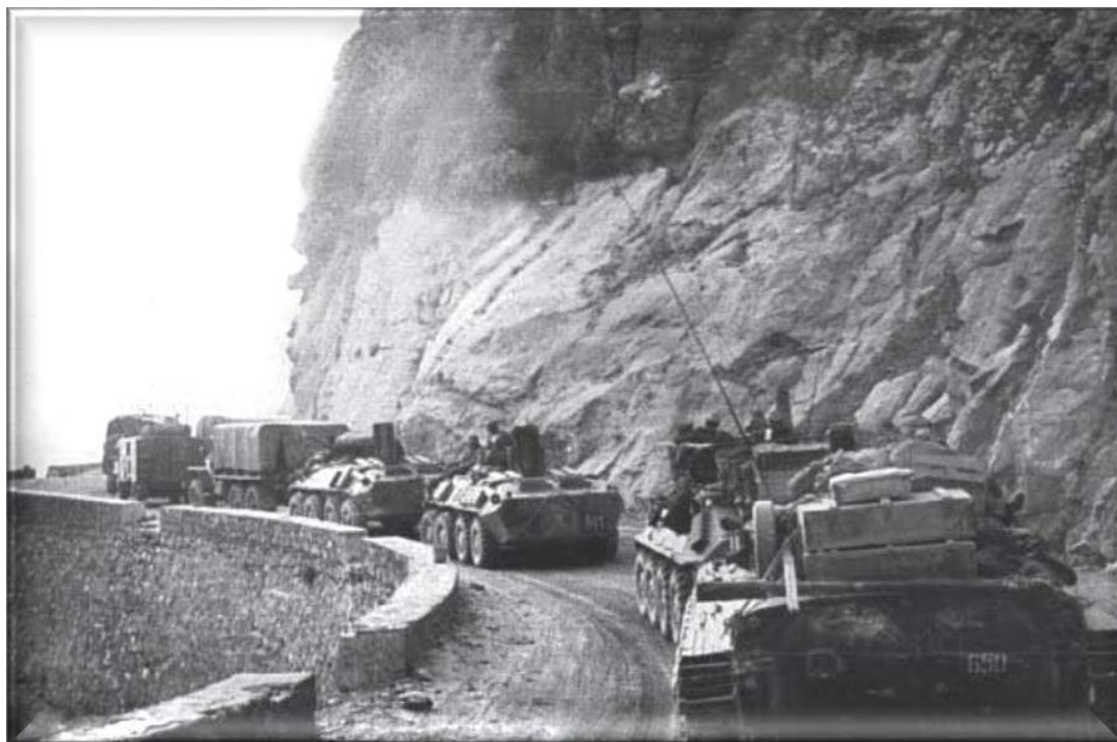
Сопровождая колонны. Афганская война. Боевые операции

Большое внимание в роте уделялось инструктажу по правилам поведения во время движения колонны. При обстреле на равнине всегда можно уйти влево или вправо. В горах дорога одна, она идет серпантином и уклониться в сторону уже не получится. Поэтому в случае подрыва экипаж машины должен был покинуть подбитую технику и эвакуироваться впереди идущую машину. А подбитую сталкивали на обочину, и движение продолжалось.